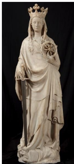
1. André Beauneveu, Sainte Catherine d'Alexandrie , 1374–86, albâtre Onze-Lieve-Vrouwekerk, Courtrai