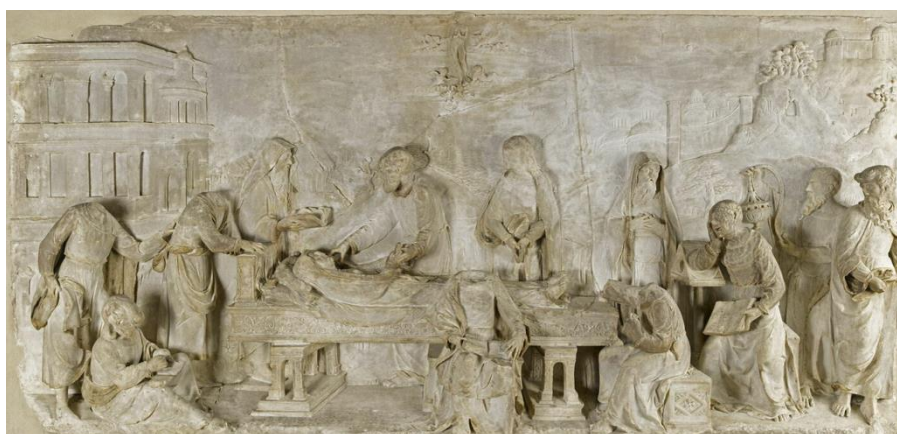
4. Attribué à Jean Juste, La Mort de la Vierge , c. 1530–40, albâtre Musée du Louvre, Paris