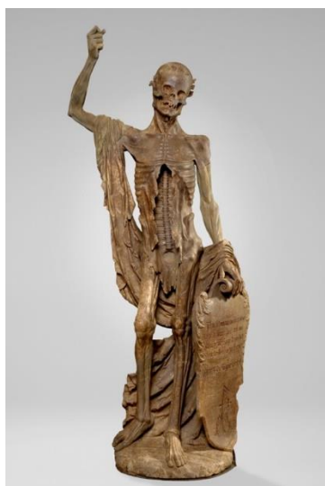
3. Île-de-France, Allégorie de la Mort (‘La Mort Saint Innocent’), c. 1530, albâtre Musée du Louvre, Paris