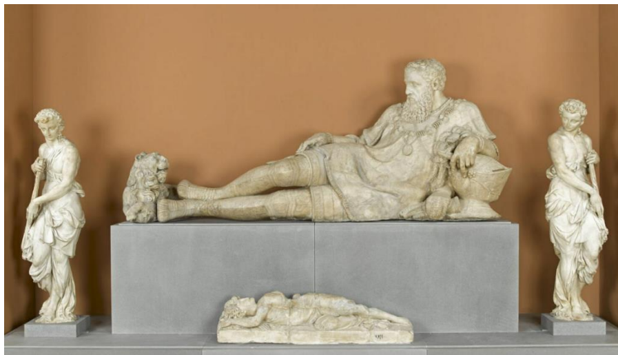
2. Jean Cousin, dit le Père, Monument funéraire de Philippe Chabot, c. 1543–1570, albâtre Musée du Louvre, Paris