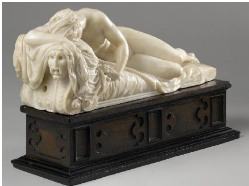
6. Attribué à Willem van den Broecke ('Guglielmus Paludanus'), Nymphe endormie ,