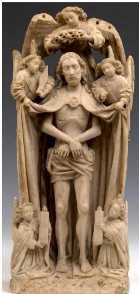
5. Pays-Bas méridionaux, L'homme des douleurs ,