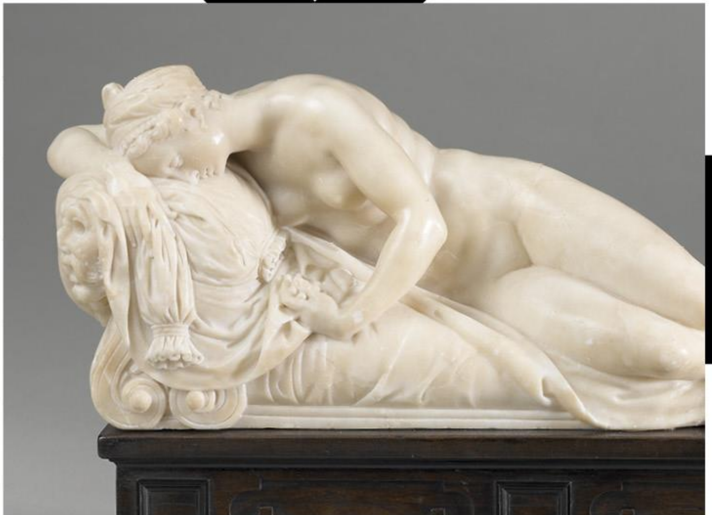
Slapende nimf | Nymphe endormie | Sleeping Nymph Willem van den Broecke, ca. 1560